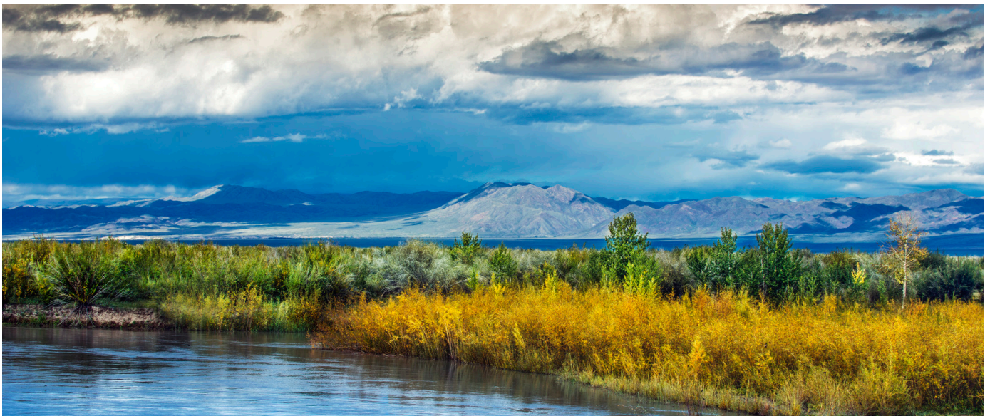
Эх оронч Тэс гол