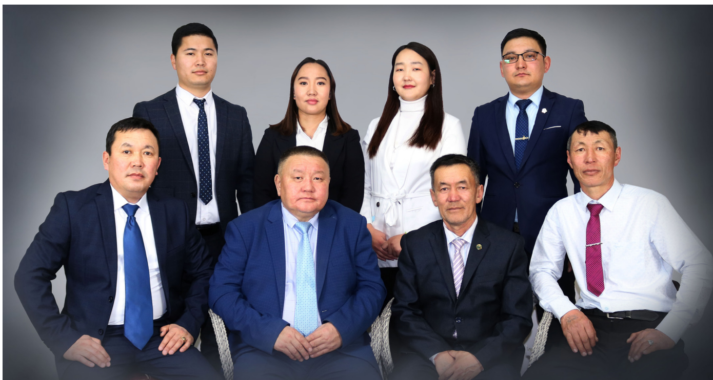
Сав газрын захиргааны хамт олон

Би ямар ч үед шударга байхыг эрхэмлэдэг. Миний улаан шугам ч гэх юм уу даа. Тухайн үеийн нийгэм биднийг ингэж л хүмүүжүүлжээ. Тийм ч учраас би байгаль орчны салбарт 21 жил ажиллахдаа тусгай хамгаалалттай газар нутаг дээр хориотой бүсэд 4 дугуйтай машины мөр гаргуулж хууль бус явдал гаргуулаагүй. Газар нутгаа ухуулаагүй. Жишээ дурдья л даа. Дархан цаазат газрын дарга байхад Хандгайтын зам барьж байсан. Мянганы зам гээд их л сүртэй аян өрнөж байгаагүй юу. Тэгээд Увс нуурын элс авч хэрэглэх гэхэд би өгөөгүй ээ. Ц.Элбэгдоржийн Засгийн газар ажиллаж байсан. Чи улс орны бүтээн байгуулалтыг зогсоолоо. Ажлаас чинь хална